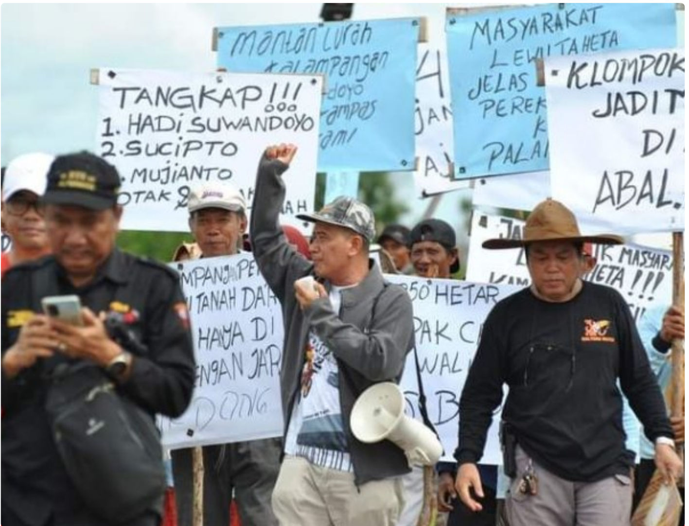
Gambar: Aksi Unjuk Rasa Masyarakat Kelompok Tani "Lewu Taheta"

PALANGKA RAYA - Sengketa kepemilikan tanah yang terjadi di Kota Palangka Raya selama ini, cukup meresahkan. Hal ini tentunya bisa mempengaruhi geliat pembangunan di ibukota provinsi Kalimantan Tengah (Kalteng) kedepannya.